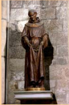
Sant Pere Regalat

13 de maig, Mare de Déu de Fàtima i Sant Pere Regalat: entre el 13 de maig i el 13 d'octubre del 1917, la Mare de Déu s'aparegué diverses vegades a tres pastoretos a la localitat de Fàtima. Des de llavors l'advocació de la Mare de Déu de Fàtima gaudeix de gran devoció arreu del món. Al Pi la devoció arriba després de la Guerra Civil, ocupant primer la capella de la Dormició de Maria, i actualment la de Sant Pancraç.