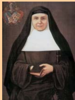
Santa Joaquina de Vedruna

Joaquina de Vedruna i Vidal (1783-1854), fou una santa nascuda al barri del Pi, batejada a la nostra parròquia. Es va casar també aquí al Pi i tingué diversos fills. En quedar vídua es feu monja i fundà, junt amb les seves filles, les Germanes Carmelites de la Caritat, també dites "Vedrunes". Morí a Barcelona i les seves despulles foren traslladades a Vic, ciutat on havia fundat el primer convent. Fou canonitzada l'any 1959. A Santa Maria del Pi hi té capella pròpia, i també es conserva una memòria del seu bateig a la capella de les Fonts Baptismals.