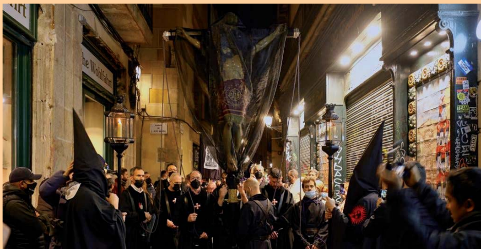
La comitica al seu pas per Banys Nous/Ave Maria