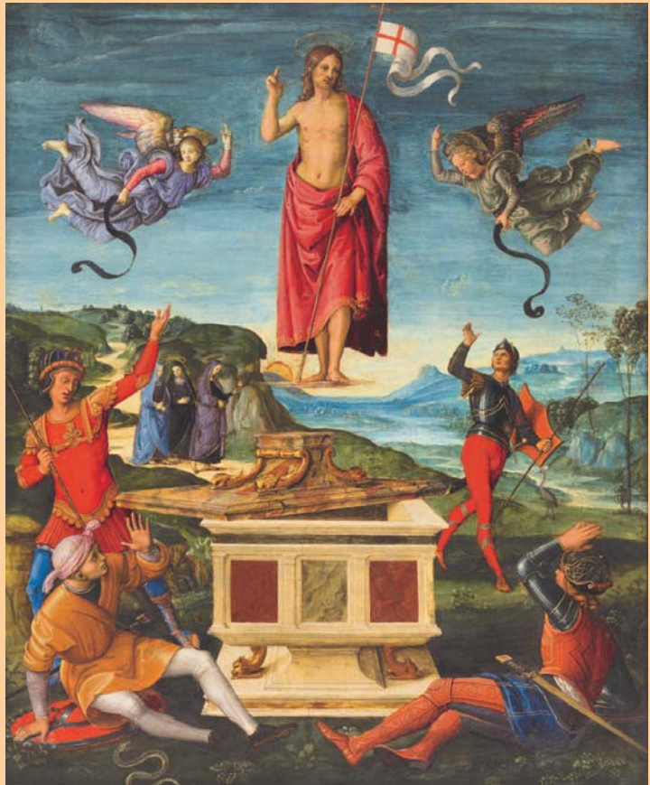
La resurrecció de Jesús, Raffaello Sanzio, (entre 1499 i 1502)

Els cristians celebrem el Dissabte Sant la festa més important de tot l'Any Litúrgic, la de la resurrecció de Nostre Senyor Jesucrist. Nosaltres no sabem a quina hora va tenir lloc, però el que sí sabem perquè ens ho diuen els evangelis, és que de bon matí, el primer dia de la setmana que per als jueus era el diumenge, quan les dones van anar al sepulcre, aquest ja era buit. Jesús ja no hi era. Només quedava el llençol d'amortallar. Ningú no va presenciar el fet més important de la història de la humanitat: la resurrecció del Senyor i, per tant, la causa de què nosaltres també puguem ressuscitar i viure amb Déu per sempre; però havia d'haver estat aquella nit, per aquesta raó els cristians ens reunim la nit del Dissabte