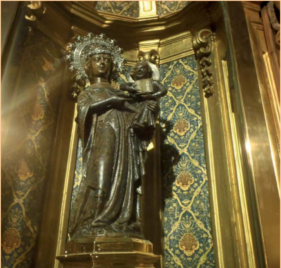
Mare de Déu de Lluç, Escorca, Mallorca