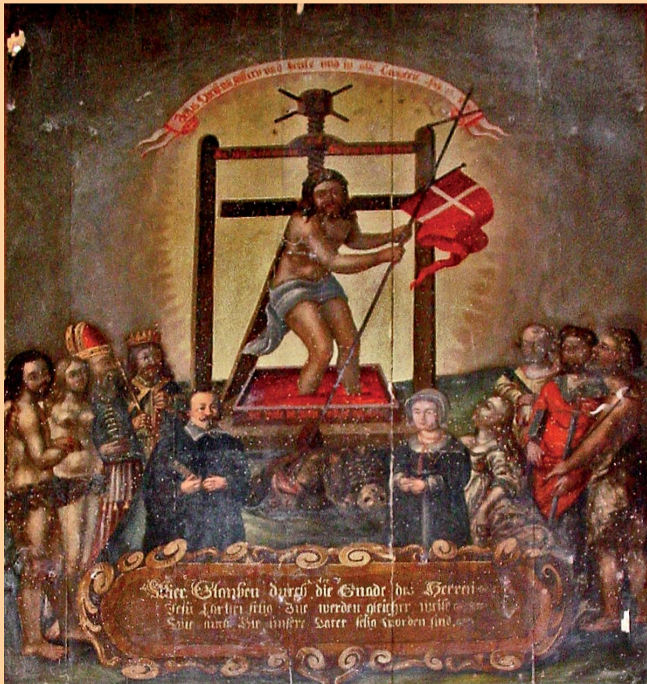
Jesus a la premsa de vi. Frontispici de la Bíblia Ernestina (1649)

Crist a la premsa de vi: això és, en el recipient on es trepitja o premsa el raïm per a obtenir-ne el most. En aquest quadre, podem contemplar l'amor que Déu Pare té per nosaltres, que no es conforma a enviar el seu Fill, sinó que, com mostra la pintura, el «tritura», fent-lo vi, perquè, quedant-se amb nosaltres, puguem dir: «Ell s'entrega per mi i jo m'entrego per Ell».