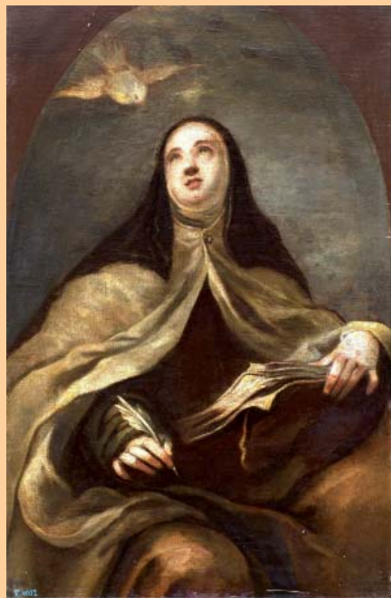
Santa Teresa de Jesús, atribuïda a Francisco de Herrera el Mozo