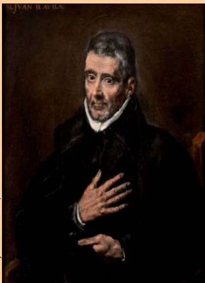
Sant Joan d'Àvila, atribuït a El Greco

De sant Joan d'Àvila es diu que abans de morir «va invocar la Mare de Déu amb el Recordare, Virgo Mater... I una de les seves últimes paraules, mirant el crucifix, va ser “ja no tinc pena d'aquest negoci”. Era el 10 de maig de 1569. Santa Teresa de Jesús, en assabentar-se de la mort de Joan d'Àvila, es va posar a plorar i, preguntant-li la causa, va dir: “Ploro perquè l'Església de Déu perd una gran columna”».