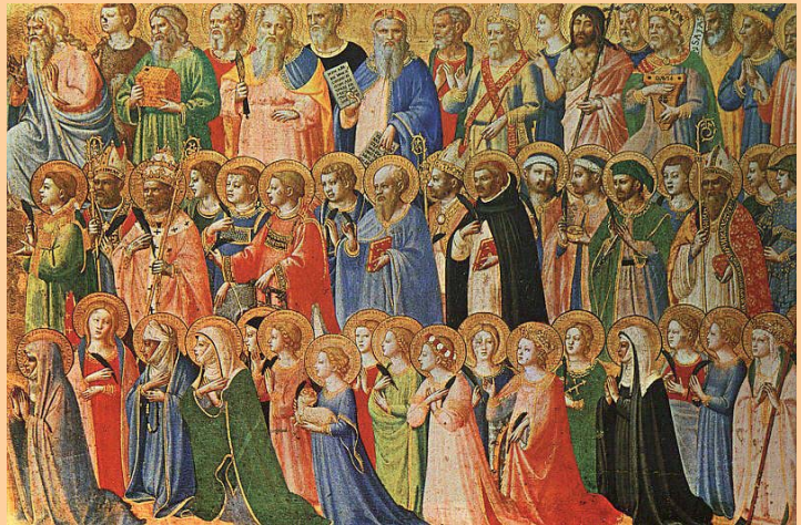
Tots Sants, Fra Angelico, s. XV

Dels màrtirs es va conservar la seva tomba o les seves relíquies, així com les Actes i Passions del seu martiri. Ja a partir del segle II hi ha documents del culte als màrtirs. Després, de mica en mica, es va començar a venerar als sants no màrtirs, com bisbes importants, doctors de l'Església, santes verges i monjos, etc. primer a nivell local i després universal.