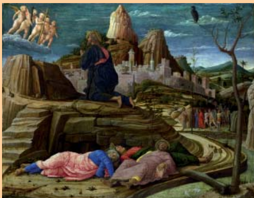
Jesús a Getsemani, A. Mantegna, s. XV

Però fins i tot en el moment del judici suprem, Déu no ens deixa sols. Quan Jesús es retira a pregar a Getsemaní, el seu cor és envaït per una angoixa indescriptible –així ho diu als seus deixebles– i Ell experimenta la soledat i l'abandó. Sol, amb la responsabilitat de tots els pecats del món sobre les espatlles; sol, amb una angoixa que no es pot explicar. La prova és tan lacerant que passa alguna cosa inesperada. Jesús no demana mai amor per a si mateix, però en aquella nit sent la seva ànima trista