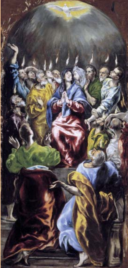
La Pentecosta, El Greco, 1597-1600 (Part del Retaulle de donya Maria de Aragón)

Pentecosta: vol dir el dia que fa el número cinquanta. És la culminació de la Pasqua.