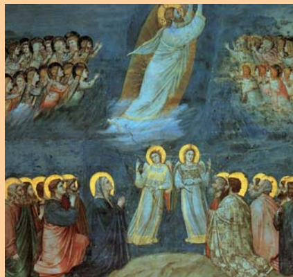
L'Ascensió del Senyor, Giotto (1267-1337), fresc de la Capella Scrovegni a Pàdua.

Estem arribant al final del temps de Pasqua. Aquest diumenge celebrem l'Ascensió del Senyor, el proper celebrarem la donació de l'Esperit Sant, la Pentecosta, i el dilluns posterior tornarem al temps litúrgic de durant l'any. Haurà estat una Pasqua atípica a causa de les restriccions imposades per la pandèmia del coronavirus (no processons amb fidels com la del ciri pasqual a la Vetlla Pasqual, no aspersió amb aigua com a signe penitencial,...) però almenys hem pogut celebrar tota la Pasqua, cosa que no va succeir l'any passat. Paga la pena que recordem el significat d'aquestes dues darreres celebracions pasquals.