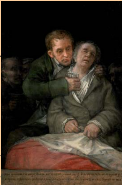
Goya atès pel doctor Arrieta, Francisco de Goya, 1820

Per tal que hi hagi una bona teràpia, és decisiu l'aspecte relacional, mitjançant el qual es pot adoptar un enfocament integral envers la persona malalta. Donar valor a aquest aspecte també ajuda els metges, els infermers, els professionals i els voluntaris a fer-se càrrec d'aquells que pateixen per acompanyar-los en un camí de curació, gràcies a una relació interpersonal de confiança.