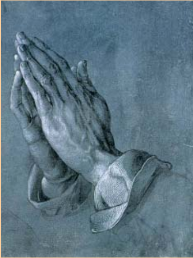
Mans en oració, c. 1508, Albrecht Dürer

Però ningú de nosaltres està obligat a abraçar la teoria que algú en el passat va exposar, que la pregària de petició és una manera de fe dèbil, mentre que la pregària més autèntica seria la lloança pura, la que cerca Déu sense el pes de cap petició. No, això no és cert. La pregària de petició és autèntica, és espontània, és un acte de fe en Déu que és el Pare, que és bo, que és omnipotent. És un acte de fe en mi, que sóc petit, pecador, pobre. I per això la pregària, per demanar qualsevol cosa, és molt noble. Déu és el Pare que té una immensa compassió de nosaltres, i vol que els seus fills li parlin sense por, directament anomenant-lo "Pare"; o en les dificultats dient: "Però Senyor, què m'has fet?". És per això que li ho podem explicar tot, fins i tot les coses que en la nostra vida romanen distorsionades i incomprensibles. I ens ha promès que estarà sempre amb nosaltres, fins a l'últim dia que passarem en aquesta terra. Diguem el Pare nostre, començant així, senzillament: "Pare" o "Papà". I Ell ens comprèn i ens estima tant!