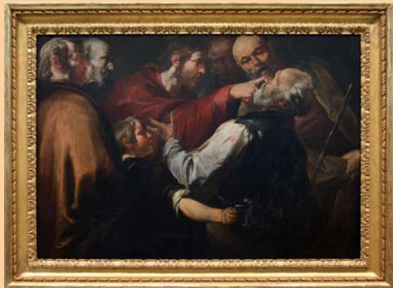
La curació del cec, c. 1640, Giocchino Assereto

Tenir fe, deia una persona, és tenir el costum de cridar. Tots hauríem de ser com aquell Bartomeu de l’Evangeli (cf. Mc 10,46-52) – recordem aquell passatge de l’Evangeli, Bartomeu, el fill de Tomeu–, aquell home cec que captava a les portes de Jericó. Al voltant seu hi havia tanta bona gent que li deia que callés: “Però calla! Que passa el Senyor. Calla. No molestis. El Mestre té tantes coses a fer; no el molestis. Tu