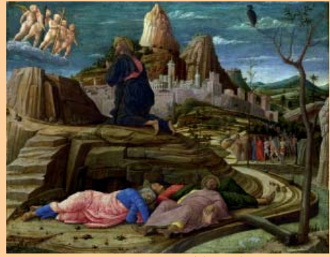
Jesús pregant a l'hort de Getsemaní, Andrea Mantegna, s. XV

En algunes pàgines de l'Esriptura sembla sobretot que la pregària de Jesús, la seva intimitat amb el Pare, ho domina tot. Ho serà, per exemple, sobretot en la nit de Getsemaní. L'última part del camí de Jesús (el més difícil dels que fins llavors va fer) sembla trobar el seu significat en l'escolta continuada que Jesús fa del Pare. Una pregària segurament gens fàcil, de fet, una veritable i real "agonia" en el sentit de l'esforç dels atletes, sinó una pregària capaç de suportar el camí de la creu.