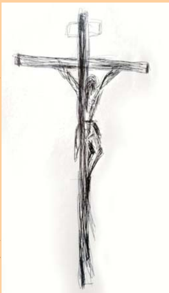
Dibuix fet per l'autor durant l'estada a l'hospital.

L'estada a l'hospital de campanya i les llargues hores enllitat van fer que tingués molt temps per a pensar i reflexionar, mirar conductes que havia tingut en el passat. Sobretot amb gent a la que estimes com són els fills i la família. Temps de fer examen de consciència i de començar a fer propòsits per a millorar. Un dels aspectes importants que vaig adoptar fou viure més el dia a dia, no planificar massa el futur llunyà. La lliçó que en vaig treure és "avui hi ets i demà no, per tant, valora el dia que Déu et dona. Gaudeix-lo i sigues sempre agraït".