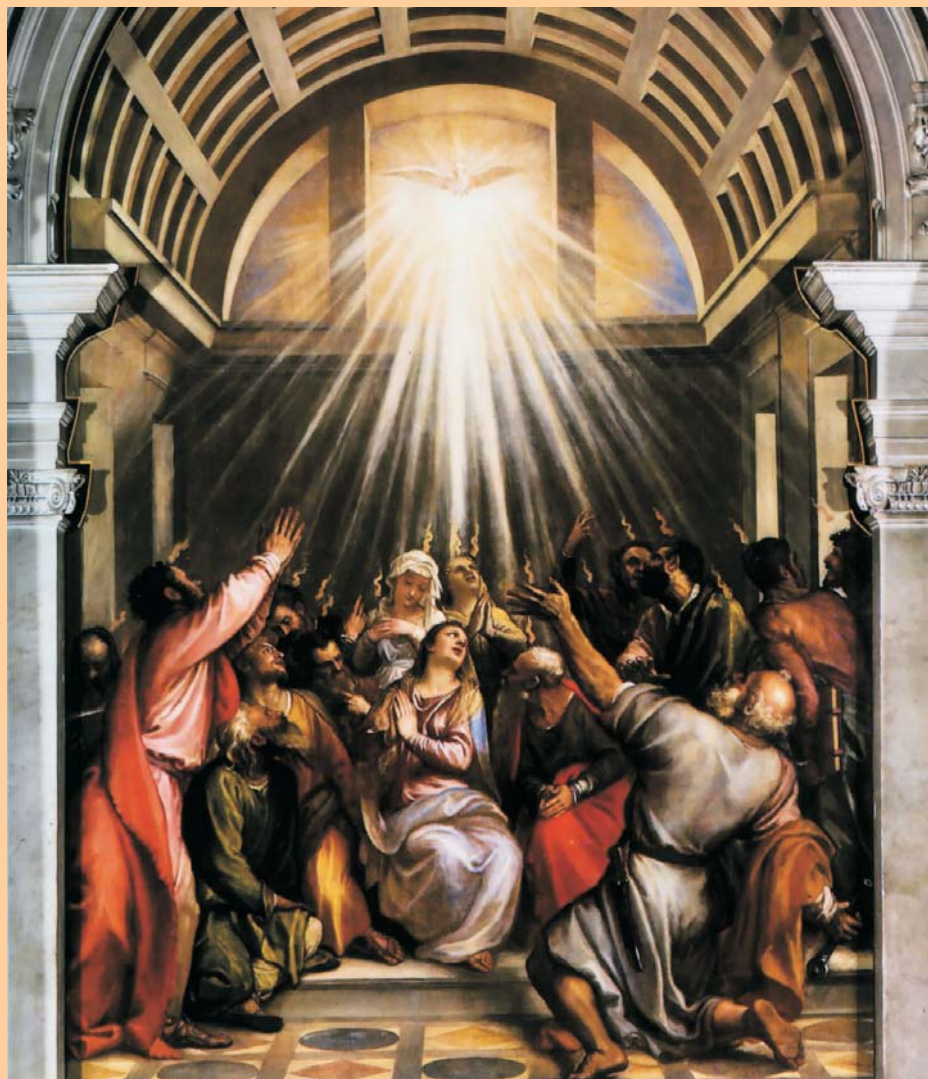
Pentecosta, de Ticià, 1546

La jornada " Pro Orantibus " té com a objectiu recordar, agrair, pregar i donar a conèixer la vocació contemplativa, tan necessària per a l'Església i el món. També qualsevol mena d'ajuda econòmica destinada al sosteniment dels monestirs serà molt benvinguda i agraiada.