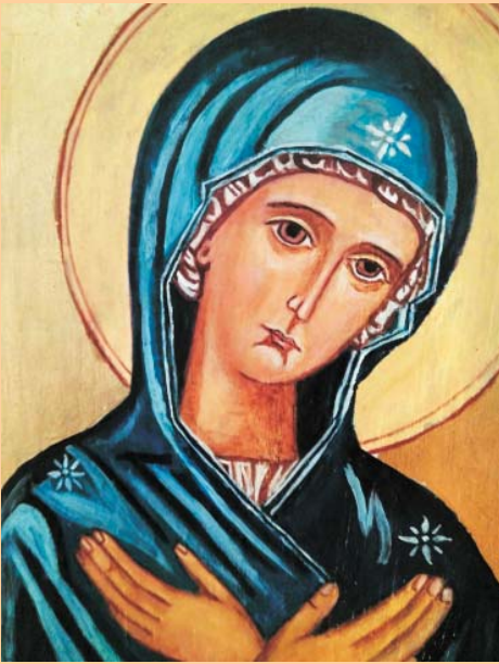
El lema d'aquestes jornades: Amb Maria al cor de l'Església

Dèiem al principi que avui celebrem també la diada dels que preguen. Es tracta del dia en què tenim més presents a les persones contemplatives, aquelles que de tant contemplar a Déu, contemplen el món amb l'esguard de Déu, una expressió que ens recorda que hem de mirar el món amb la mateixa mirada de Déu. I, com és l'esguard de Déu?