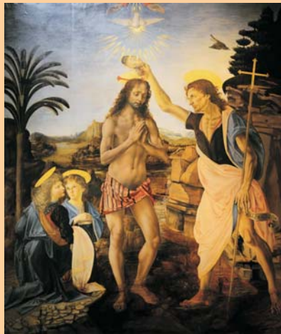
Baptisme de Crist (Verrocchio i Leonardo, c. 1472-1475)

La Trinitat no consisteix simplement en un enigma dogmàtic: és un misteri en el qual podem penetrar a través de Jesucrist. És la manera de Jesús de Natzaret de dir Déu. En el discurs del darrer Sopar, Jesús anuncia que enviarà l'Esperit del Pare (Jn 14, 25-26). Cal destacar altres dos moments de l'Evangeli. Primer, al començament de la vida pública, l'escena del baptisme és particularment reveladora: ens presenta un Déu en relació quan la veu del Pare designa el Fill estimat, damunt del qual baixa