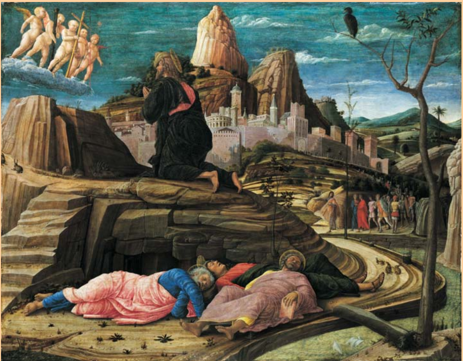
Jesús pregant al Mont de les Oliveres, Andrea Mantegna (segle XV)

Jesús pregava amb els salms. Com a bon jueu, se'ls sabia de memòria, els recitava sovint, comunitàriament o tot sol. Per exemple, en els moments culminants de la passió hi trobem una recitació comunitària dels salms i una d'individual. La comunitària és en acabar el sopar pasqual, quan es disposen a anar cap a l'hort de Getsemani. Diuen els evangelistes: “després de cantar els salms, van sortir cap a la muntanya de les Oliveres” . Ho llegim a Mateu 26,30 i a Marc 14,26. I és que, en acabar el sopar de la Pasqua jueva, es cantaven sempre quatre salms de lloança, del 115 al 118 (113B al 117) per agrair a Déu la seva obra alliberadora. La individual és molt més coneguda: és a la creu, en el moment més tràgic. Allà Jesús es queixa a Déu del seu abandó amb les paraules del salm 22 (21): “Déu meu, Déu meu, ¿perquè m'heu abandonat?” .