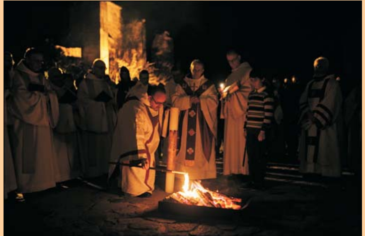
Ritus del Foc Nou al monestir de Poblet

A partir d'aquest dissabte per la nit, amb la Vetlla Pasqual comencem a celebrar la Pasqua del Senyor, celebració que es perllongarà cinquanta dies fins el Diumenge de Pentecosta, enguany el 31 de maig, amb la donació de l'Esperit Sant.