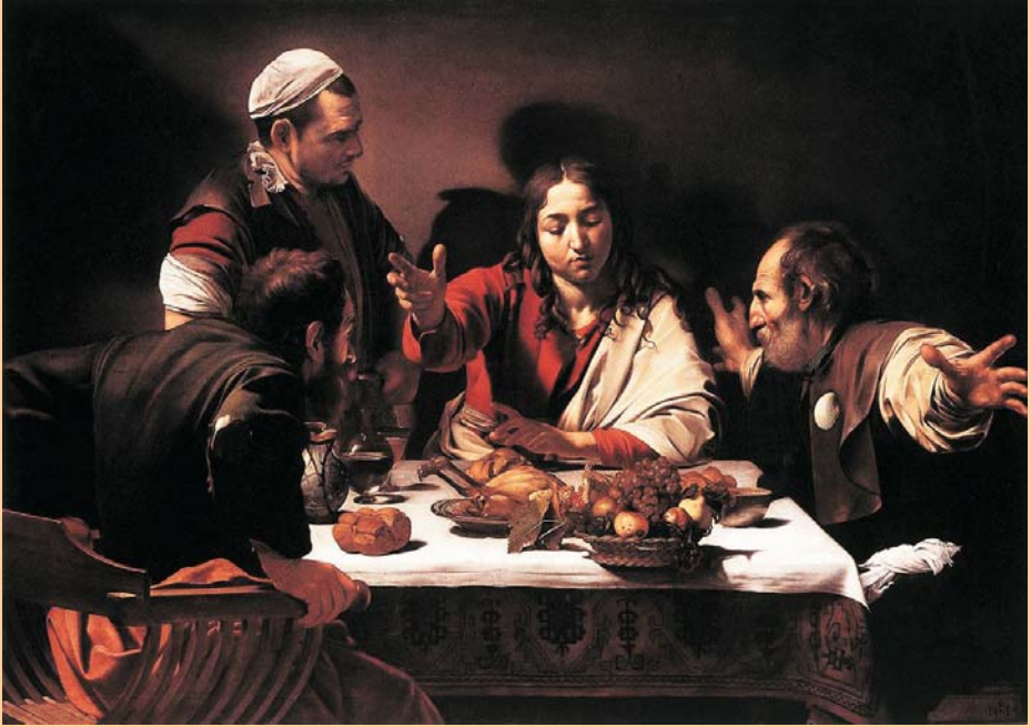
El sopar a Emmaús, 1601-1602, Caravaggio

Ara mirem la vida amb ulls nous, perquè creiem que Jesucrist ha transformat la humanitat i ha començat una nova creació. Ara la humanitat ha penetrat en la vida nova de Déu doncs el pecat i la mort han estat vençuts. I encara que el sofriment i el mal persisteixen, sabem que ja no tenen la darrera paraula.