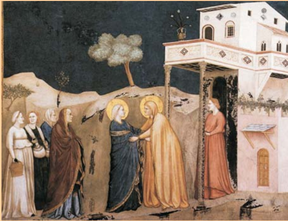
La Visitació, fresc de Giotto a l'església de Sant Francesc a Assís

Maria des del Cel encoratja la nostra esperança; i els consagrats participen d'aquesta missió de portar esperança a un món que pateix: