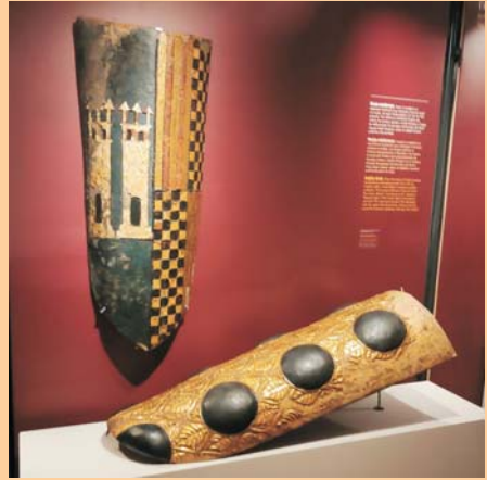
Els dos pavesos tal i com es estaven exposats al Saló del Tinell