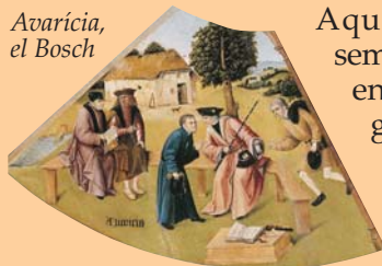
Avaricia, el Bosch

Un nou any és una nova oportunitat per a viure amb sentit, amb plenitud. Desgraciadament hi ha molts moments de la nostra vida en els quals perdem el temps, però a més a més, pot ser que la nostra existència la tinguem mal orientada. Hi ha moltes persones que donen importància al que realment no en té i en canvi no fan cas de les coses que veritablement són transcendents.