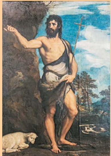
Sant Joan Baptista, de Tiziano, 1542

Hi ha tres modalitats de confessió: la individual, que nosaltres oferim quan se'ns demana; la individual amb preparació comunitària, que és la que nosaltres oferirem dos cops a l'any, una ara per l'Advent i l'altra per