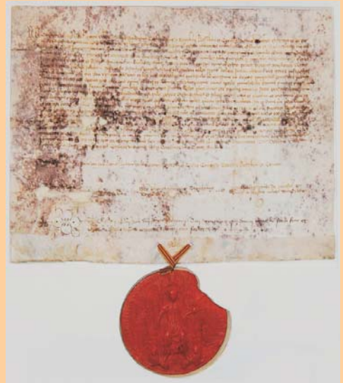
Reial Privilegi de Pere III

A mesura que la crisi del segle XV augmentava, el nombre de pobres vergonyants va anar creixent. En conseqüència, va créixer també la dificultat per retornar els censals que el bací havia prestat. Per contra, hi havia qui s'havia enriquit gràcies a la crisi i feia importants donacions, conscients que podien necessitar ajut en algun moment de la seva vida.