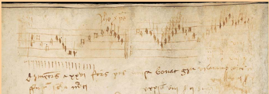
Fragment de música mensural amb polifonia a dos veus aparegut en una llibreta de comptes de 1422

A partir d'aquest moment les notícies relatives a la Capella de Música de Santa Maria del Pi sovintegen, normalment relacionades amb assumptes de gestió però també amb algunes notícies d'actuacions musicals memorables a la ciutat com la intervenció, magnífica en la opinió dels cronistes, que realitzà durant els actes litúrgics a l'entorn de les festes per l'arribada de la relíquia de Sant Isidre a Barcelona l'any 1623, o la participació, juntament amb les altres grans capelles de Barcelona, en l'ofici d'acció de gràcies que el noble Dalmau de Queralt i de Codina, comte de Santa Coloma i virrei de Catalunya, va patrocinar en acció de gràcies per la presa del castell de Salses a principis de l'any 1640.