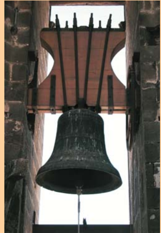
La campana Antònia del Pi

L'Associació d'Amigues i Amics del Campanar de Santa Maria del Pi porten ja tres anys d'activitat recuperant els repics de campanes i fent recerca dels tocs que hi havia a la ciutat de Barcelona. L'entitat s'ha ofert a altres grups per ajudar a recuperar el so manual de les campanes, molt diferent al dels actuals sistemes electromecànics, i que a la nostra ciutat s'havia perdut des de poc després de la Guerra Civil.