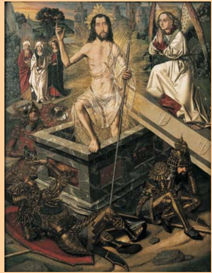
Taula de la Resurrecció, Bartolomé Bermejo (1440-1501)

5. Dia de la reconciliació fraterna: tots necessitem de llocs i moments terapèutics, i l'Eucaristia dominical és un d'ells perquè ens donem la mà, ens concedim mútuament la pau, ens atorguem el perdó.