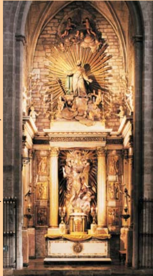
Retaule de la capella de Sant Miquel

Al Pi ha estat sempre una de les entitats més vinculades i de les que més patrimoni ha deixat. Al poc temps d'instal·lar-se a la parròquia van encarregar a Jaume Huguet un gran retaule dedicat a Sant Miquel, una de les seves millors obres, que actualment es conserva al Museu d'Art de Catalunya. El retaule es va beneir, junt amb la capella el 1456. Més endavant van substituir-lo per un retaule barroc, i aquest, al seu torn pel magnífic retaule de línies neoclàssiques que encara avui es pot veure a la segona capella entrant al temple per la dreta. També van encarregar l'any 1816 a Damià Campeny la factura del seu misteri processional per a la Setmana Santa, la Deposició de Nostre Senyor Jesucrist al Sepulcre, que també podeu veure a la capella lateral anterior al pas de la sagristia.