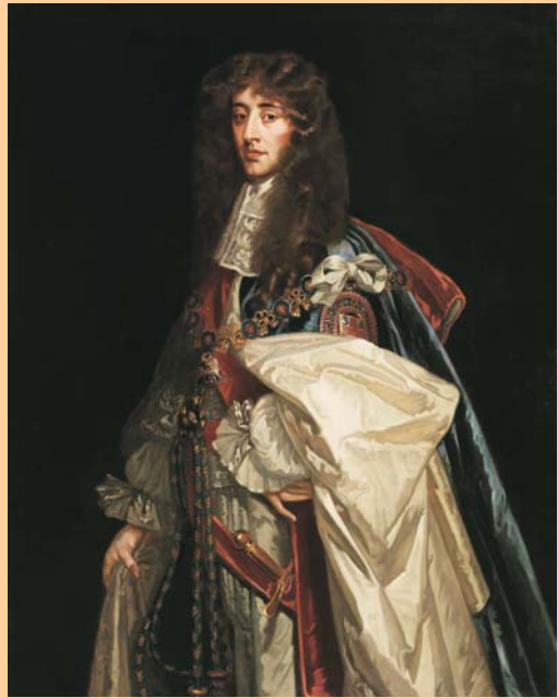
James Fitz-James Stuart, Duc de Berwick (1670-1734)