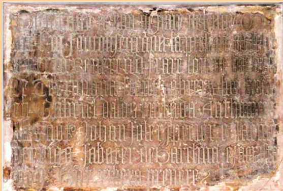
Inscripció de la consagració

Hem passat dues setmanes amb dates molt sucoses per parlar d'efemèrides: el 17 de juny es celebra la consagració de l'església del Pi, feta pel bisbe de Terranova (Sardenya) Fra Llorens Scopolart l'any 1453, és a dir fa 566 anys, tal i com consta en una inscripció epigràfica que trobareu al portal de l'Ave Maria, sota l'orgue, a la part dreta. És una data fàcil de recordar, perquè aquell mateix any va caure la ciutat de Constantinoble a mans dels turcs, només unes setmanes abans de la consagració del Pi, fet que suposà un punt i apart en la història universal.