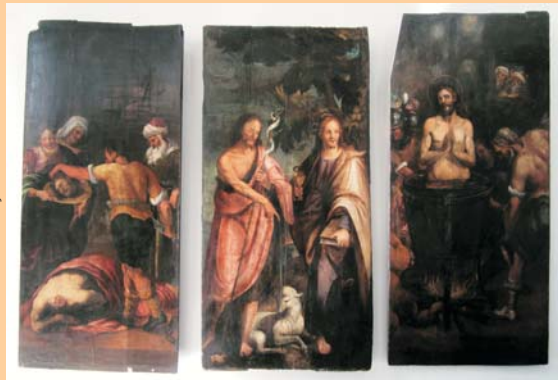
Retaulle dels Sants Joans

Dilluns passat també vam celebrar la festa de Sant Joan, una advocació de la que se'n té coneixement al Pi des del segle XIII, i que ocupava l'actual capella de Santa Joaquina de Vedruna des del moment en que es va construir l'església gòtica. Prova d'aquesta antiga advocació en són les tres taules que es conserven al Museu del Pi de l'antic retaulle dels Sants Joans, que ocupava aquella capella fins a principis del