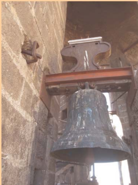
Campana Vicenta, condemnada per la intervenció de 1989-1991

Pels que es vulguin fer socis de l'associació el nostre mail de contacte és campanespi@gmail.com I pels que vulguin fer aportacions econòmiques ho podeu fer al nostre compte corrent: ES84 1491 0001 2230 0010 6209 de Triodos Bank, deixant constància del vostre nom i cognoms. D'aquesta manera podrem comptar-vos com a mecenes i convidar-vos a participar en les accions i activitats que l'Associació dugui a terme.