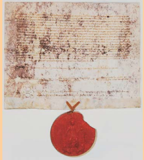
Reial Privilegi de Pere III

A mesura que la crisi del segle XV augmentava, el nombre de pobres vergonyants va anar creixent. En conseqüència, va créixer també la dificultat per retornar els censals que el bací havia prestat. Per contra, hi havia qui s'havia enriquit gràcies a la crisi i feia importants donacions, conscients que podien necessitar ajut en algun moment de la seva vida.