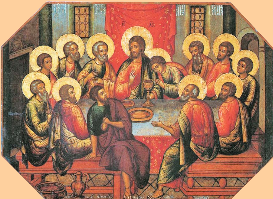
La sopa mística, Simon Ushakov, 1685

Tots dos signes són manifestació del nucli més profund de la persona de Jesús: «els demostrà fins a quin punt els estimava». Aquesta és la clau per a comprendre tot el que s'esdevé en aquests dies del Triduum Pasqual, en els quals celebrem el misteri central de la nostra fe.