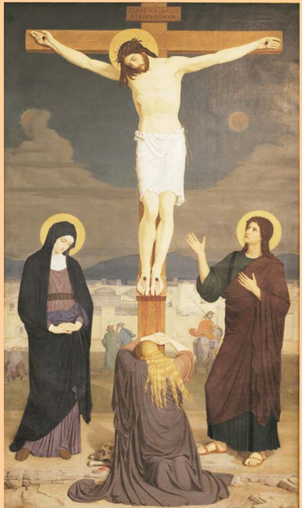
Representació de Stabat Mater, 1868

Per a molta gent avui és el dia en què el sentiment religiós es viu més a flor de pell. És fàcil compadir-se de Jesús i connectar el seu sofriment amb tant de dolor que vivim en primera persona o que veiem que existeix arreu del món. Però cal que no ens quedem en la superfície. El missatge del Divendres Sant és aquest presagi de victòria, aquest sentit amagat en el cor de l'aparent manca de sentit de les injustícies, la violència i la mort que semblen envair-ho tot però no tenen la darrera paraula.