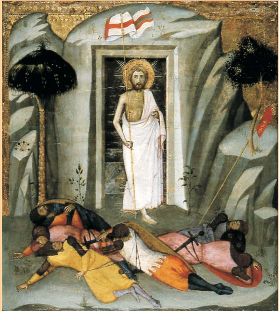
La Resurrecció, de Andrea di Bartolo

«Per què busqueu entre els morts aquell qui viu?»