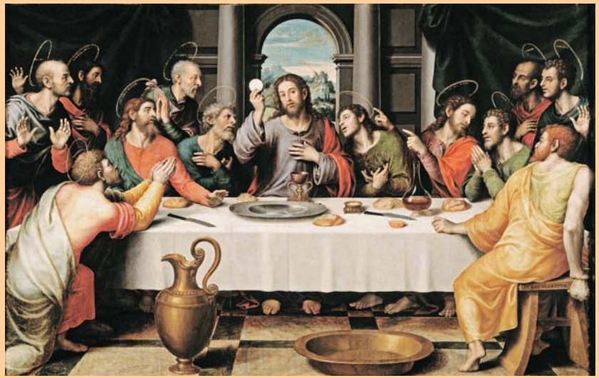
El Sant Sopar, Joan de Joanes (1510–1579)

Aquest dia també recordem el tràngul de Jesús a l'hort de Getsemaní, la traïció de Judes i l'empresonament de Jesús.