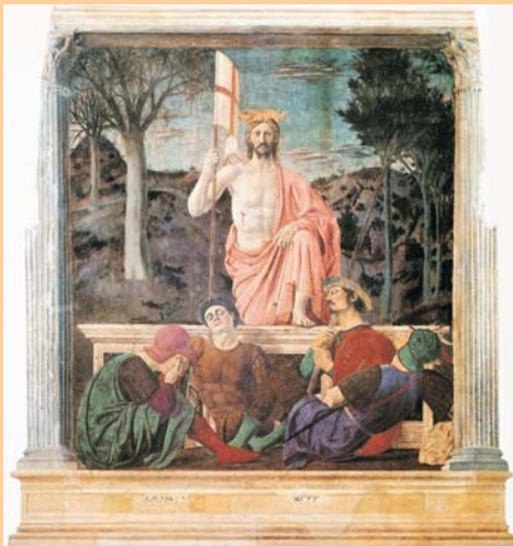
La Resurrecció de Crist, Piero della Francesca (1420–1492)