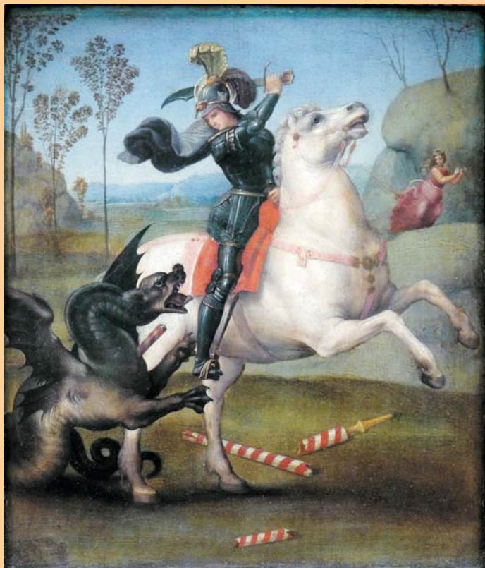
Sant Jordi, de Rafael

Però ara som nosaltres mateixos qui ens trobem en mig d'un contenciós agressiu i destructor que ha adoptat males maneres: la mentida, la difamació, la repressió, la violència, amb l'afany d'obtenir rèdits inconfessables. La política, en les nostres comunitats germanes de la Hispània i en el