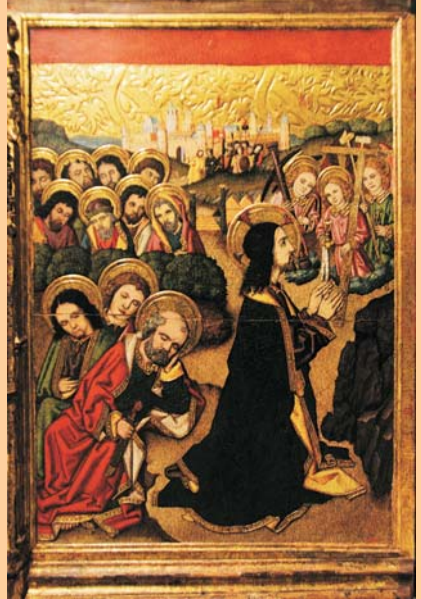
Oració a l'Hort de Getsemani, Joan Gascó, entre 1495 i 1500

En els moments en què els dubtes i les pors inunden els nostres cors, resulta imprescindible el discerniment. Ens permet posar ordre en la confusió dels nostres pensaments i sentiments, per actuar d'una manera justa i prudent. (...) Demaneu-vos: avui, en la meva situació concreta, què és el que m'angoixa, què és el que més temo? Què és el que em bloqueja i m'impedeix avançar? Per què no tinc el valor per prendre les decisions importants que he de prendre? No tingueu por de mirar amb sinceritat les vostres pors, reconèixer-les amb realisme i afrontar-les. (...) Jesús mateix, encara que en un nivell incomparable, va experimentar la por i l'angoixa (Mt 26,37, Lc 22,44).