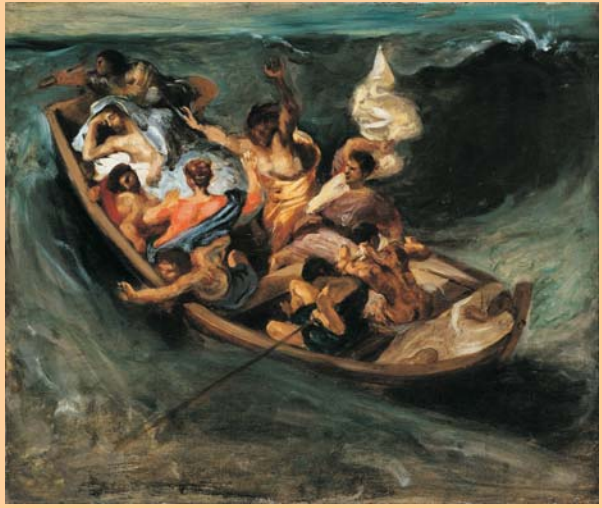
Crist al mar de Galilea, Eugene Delacroix (1841)

bondat fonamental de l'existència que Déu ens ha donat, confiar que ell ens porta a un bon final a través també de les circumstàncies i vicissituds que sovint són misterioses per a nosaltres. Si per contra al·lomentem la por, tendrem a tancar-nos en nosaltres mateixos, a aixecar una barricada per defensar-nos de tot i de tots, i quedarem paralizats. Hem de reaccionar! No tancar-nos mai! En les Sagrades Escriptures trobem 365 cops l'expressió «no tinguis por», amb totes les seves variacions. Com si volgués dir que tots els dies de l'any el Senyor ens vol lliures de la por. (...)