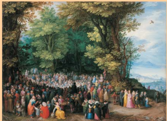
El sermó de la muntanya, de Jan Bruegel el Vell, 1598

Recordeu bé això, si algú té coses dolentes dins seu i que no sap com resoldre-les, que es dirigeixi a Déu i li digui Pare i Ell li respondrà. No ens ocultarà la seva presència, ni es tancarà en silenci: ens dirà que mai ens ha perdut de vista.