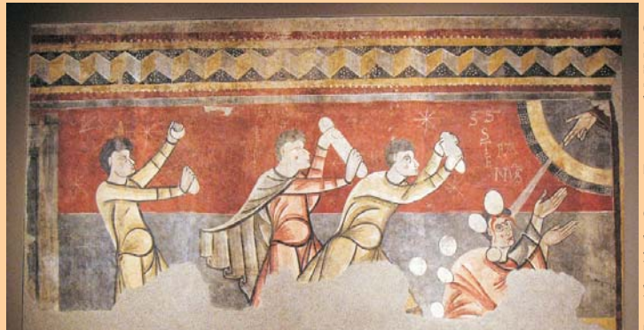
Lapidació de Sant Esteve, al MNAC

3. El dia després de Nadal, l'Església ens presenta un dels set diaques, Esteve. Ple de l'Esperit Sant, seguint a Jesús, és el primer màrtir.