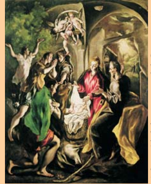
Adoració dels pastors del Greco, 1605

Imaginem una dona, Maria, que ha de fer molts quilòmetres esperant un fill que ja està a punt d'infantar. L'Infant, el fill de Maria i de Josep, neix fora de casa seva, com també neixen molts nadons avui, a prop nostre, i tantes dones embarassades o amb fills que viatgen quilòmetres i quilòmetres per arribar a una terra on viure millor. Molts d'ells moren en els nostres mars.