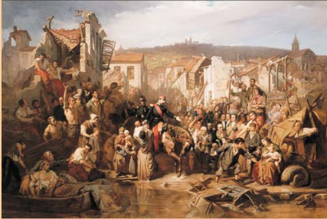
Napoleó III visitant als sinistrats per les inundacions de Lió. (Hippolyte Lazerges, 1856).

Déu ens regala els seus sants per tirar endavant l'Església i l'Evangeli en mig del món; i molts els segueixen.