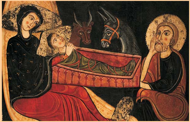
Fragment del frontal romànic de Santa Maria d'Avià.

El segon engany passa per la superficialitat i felicitat imposada durant les festes que acaba per diluir el caràcter revolucionari del Nadal cristià. No oblidem quina és la proposta del Nadal: Déu ha estimat tant la humanitat que ha decidit