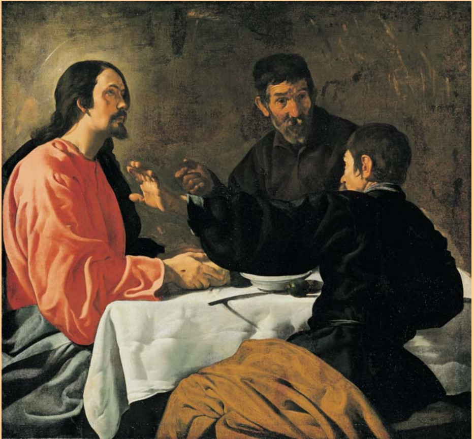
El sopar a Emmaús, Velázquez, 1622-23

Jesús no ens deixa mai perquè sempre ens acompanya!