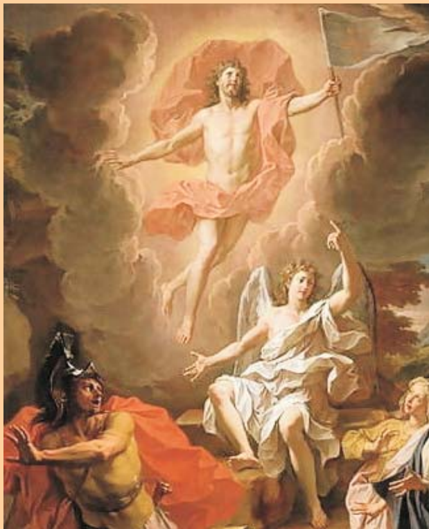
Resurrecció de Crist, Noël Coypel, 1700

La mort va voler engolir Jesús, com havia fet fins aleshores amb tots els humans caiguts sota el seu domini. Jesús va davallar als inferns, al regne dels morts, d'on ningú havia tornat. I la mort va ser vençuda en el seu propi cau.