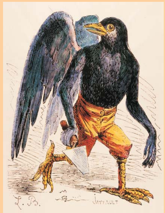
Representació del dimoni Malfàs