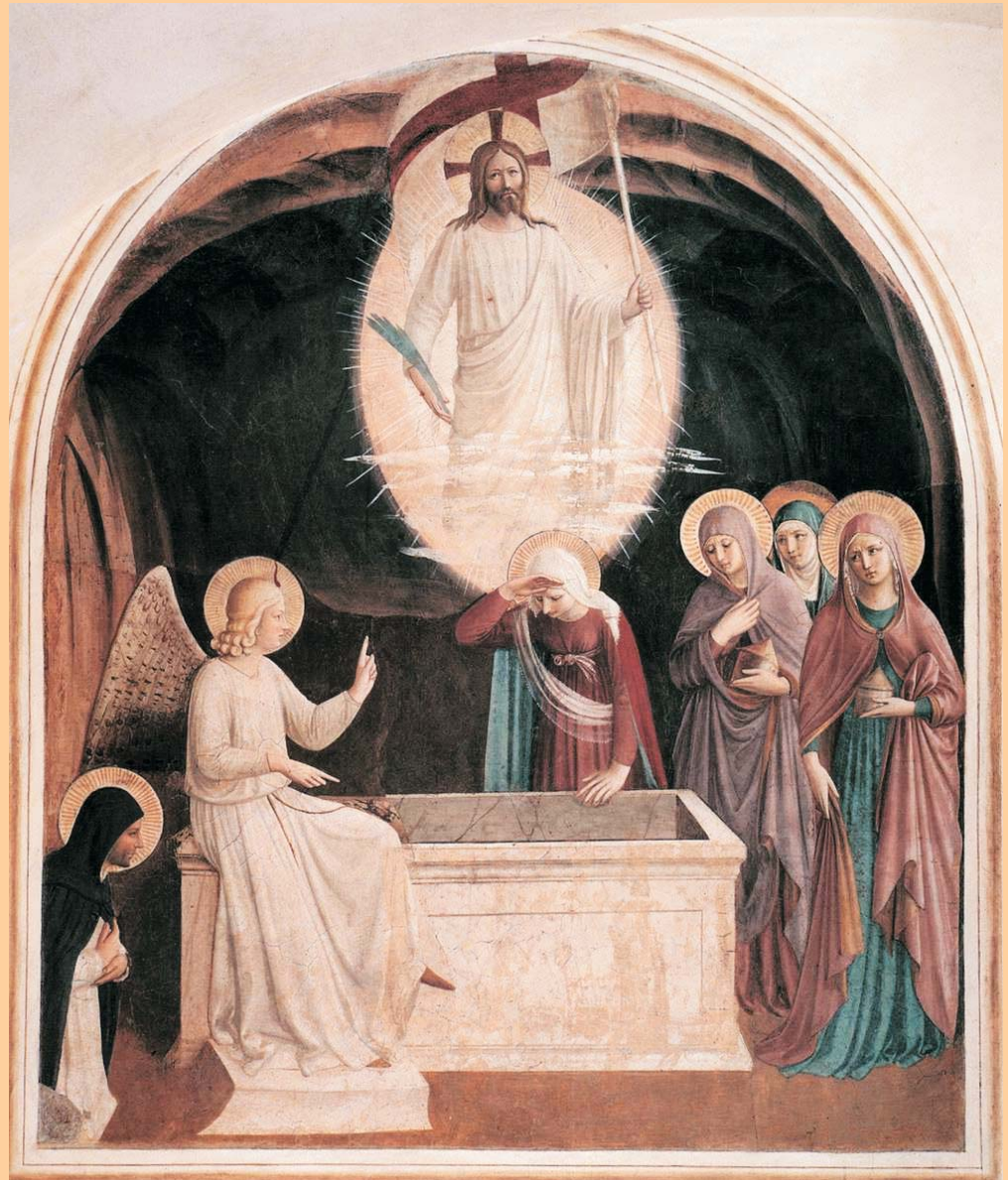
Dones en la tomba buida, de Fra Angelico , 1437-1446

«Per què busqueu entre els morts aquell qui viu? No és aquí: ha ressuscitat».