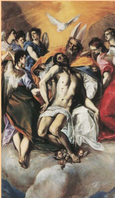
La Trinitat, El Greco, 1577-1579

És molt important per a la gent més gran aquest accent en el Déu de la misericòrdia que sempre fa el Bisbe de Roma Francesc i que intenta fer-nos comprendre al veritable Déu Pare.