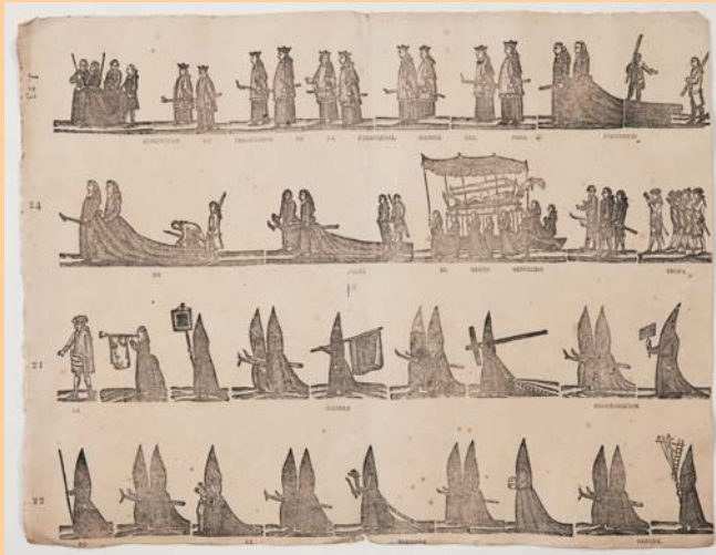
Full de rengle de la processó de la Puríssima Sang de Santa Maria del Pi

De resultes de la cessió d'aquests elements per l'exposició, el Museu d'Història de Barcelona ha restaurat el gravat de Sant Josep Oriol i el de la primera pedra de l'església de la Mercè, que tornaran a l'Arxiu en molt més bones condicions.