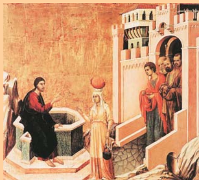
Crist i la dona samaritana, Duccio di Buoninsegna, (entre 1308 i 1311)

La samaritana és la primera candidata a la fe en aquest Evangelí de Joan. Ella serà un model del Catecumen dels primers cristians i ella, primera propagandista de la fe.