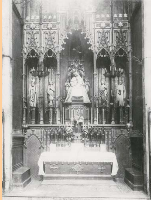
Retaule de la Mare de Déu de la Providència abans de 1936