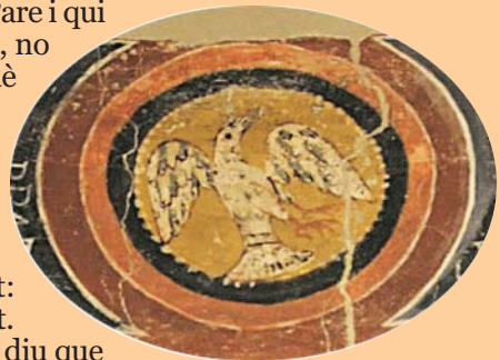
Esperit Sant. St. Pere de Sorpe