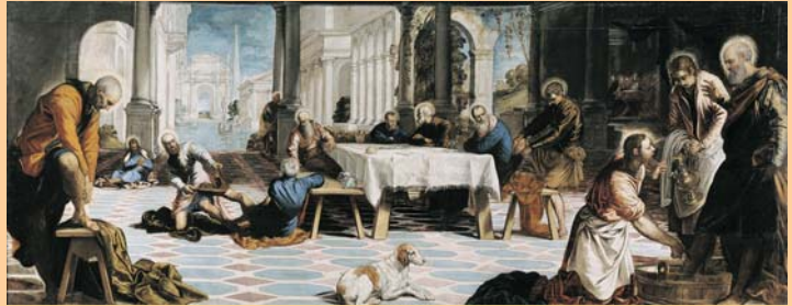
Lavatori dels peus, de Tintoretto (1518-1594)

1. Abans de la festa de Pasqua, Jesús sabia que havia arribat la seva hora de passar d'aquest món al Pare. Ell va estimar els seus deixebles que eren al món fins a l'extrem. S'aixecà de taula, es tragué el mantell, prengué una tovallola i es posà a rentar els peus als seus deixebles (cosa que feien els esclaus). En acabar, Jesús els diu: "Si jo, doncs, que sóc el Senyor i el Mestre us he rentat els peus, també vosaltres us els heu de rentar els uns als altres" (Jo 13).