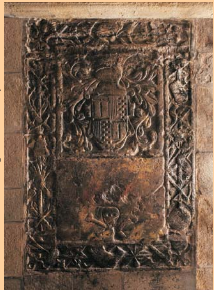
▼ Sepultura de la família Torres