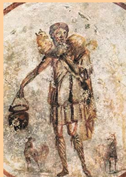
El Bon Pastor a la catacumba de St. Calixt

Diu Jesús: allò que el Pare m'ha donat, val més que tot i ningú no ho podrà arrencar. Déu és fidel i fa allò que diu. Ningú no té més poder que Déu que ens ha creat i ens ha estimat des de sempre per sempre. Jesús ha donat la vida perquè cap dels seus es perdin. Si estan malalts, els cuida i si són ferits els va a buscar on calgui, com fa amb la ovella perduda. El Bon Pastor no abandona ningú. Jesús ens ha ensenyat i ha fet possible una humanitat nova, el Regne on Déu ens encamina. Aquest projecte de Déu ens demana col·laboració, per això ens va alimentant de moltes maneres, ens acompanya fins a la mort i a l'entrada al Regne definitiu.