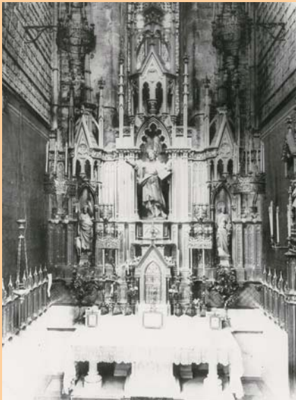
▲ Retaule de Sant Pançraç abans 1928