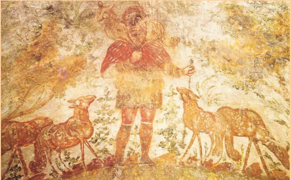
El Bon Pastor a les catacumbes de Domitil·la ▼

Per ressaltar la importància del Bon Pastor en el món cristià dels primers segles, cal saber que, per a nosaltres, el símbol més important és la Creu que ens recorda sempre com Jesús ens ha estimat i com el Pare l'ha ressuscitat a Ell i ho farà amb nosaltres en morir. Però l'Església antiga tenia com a símbol-signe el Bon Pastor. En una làpida sepulcral cristiana de finals del segle III hi trobem una imatge del Bon Pastor, a les catacumbes de Domitil·la, a Roma. Simbolitzava el descans i la felicitat del difunt per arribar a la vida eterna. Aquesta imatge suggereix el sentit global del compendi Jesucrist, Bon Pastor que guia i protegeix les seves ovelles o fidels, a qui atreu amb la flauta o melodia de la veritat i les fa reposar a l'ombra de l'arbre de la vida, la seva Creu redemptora que obre les portes del Paradís. (Del símbol en el catecisme nou de l'Església universal, 1992).