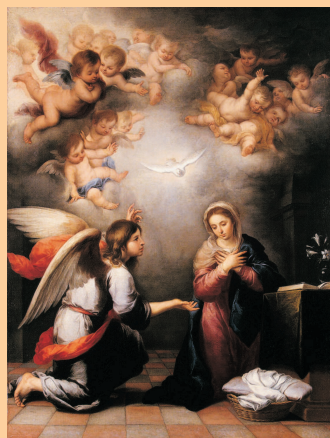
L'Anunciació. Murillo, 1655

Possiblement, Maria no entén els àngels però sí els pastors "que van saber el que