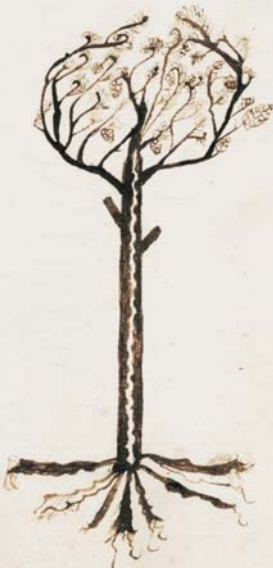
APSMP/ El senyal del Pi, d'un capbreu de 1528