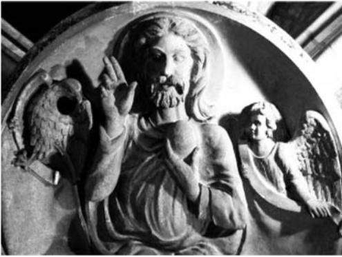
Clau de volta del presbiteri

Una de les primeres coses que sempre expliquem a la gent que ve a visitar la nostra basílica és que es tracta d'un temple d'estil gòtic català.