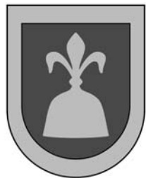
Escut de Ponç de Gualba