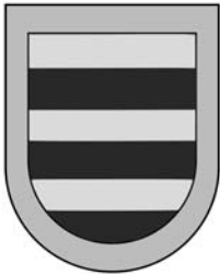
Escut d'Alfons de Tous