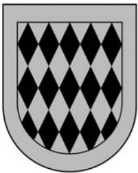
Escut de Felip de Malla