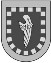
Escut de Bernat de Santa Eugènia