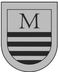
Escut de Gabriel Miró

-Bernat de Santa Eugènia fou rector del Pi entre 1306 i 1329, no en tenim massa informació però sabem que va ser sota el seu mandat que es va decidir la nova construcció de l'església gòtica, substituint la romànica, i que s'hi posà la primera pedra pels volts de 1320. També sabem que es venguè unes cases i part de l'hort de la rectoria per afavorir la construcció del temple.